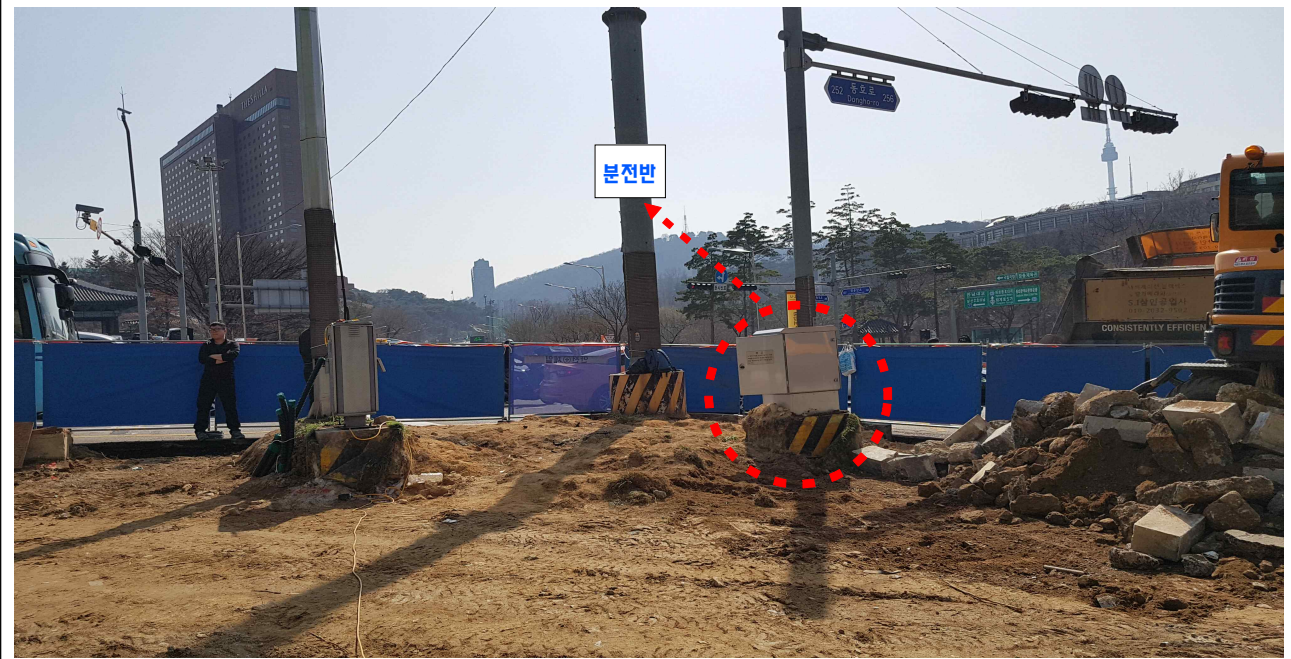
장충체육관앞 교차로 장충교회앞 A교통섬 CCTV 분전반 → CCTV지주 통합 이설, 신호등 이설, 조명탑 이설, 지적삼각점 이설