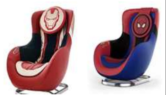
히어로 컨셉 콜라보레이션