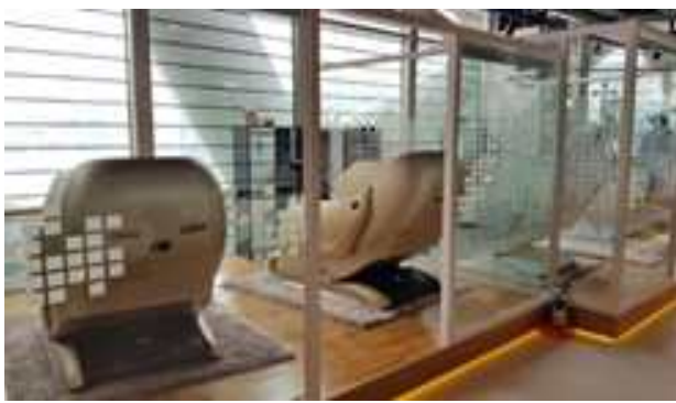
프리미엄 안마 체어