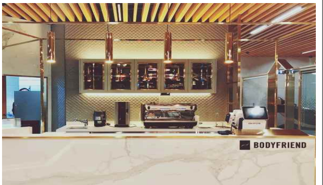
카페 프론트 데스크