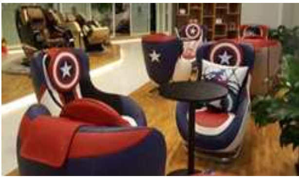
마블 컨셉 콜라보레이션