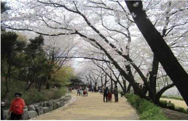
▲ 서대문구 안산문화쉼터(벚꽃)