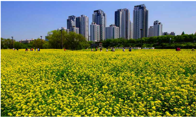
▲ 서초구 반포 서래섬(유채꽃)