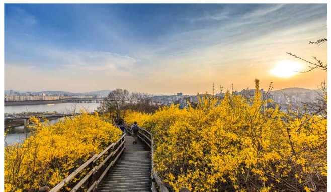
▲ 성동구 응봉산(개나리)