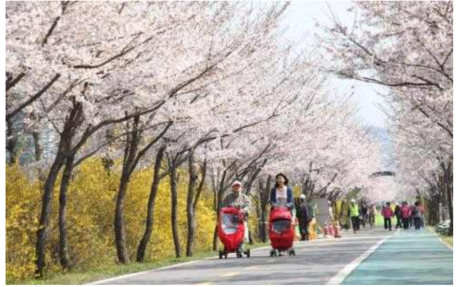
▲ 금천구 안양천 제방(벚꽃, 개나리)