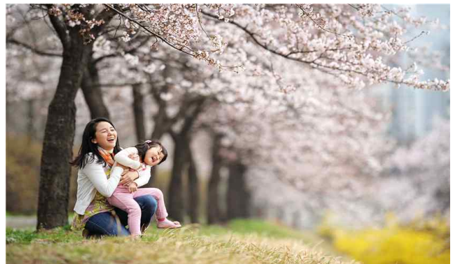
▲ 송파구 성내천길(벚꽃,개나리)