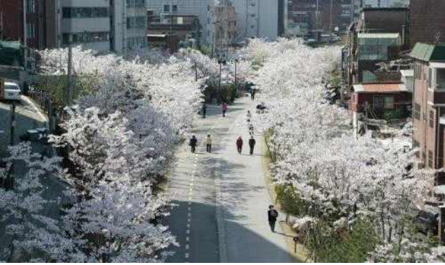
▲ 마포구 경의선숲길(벚꽃)