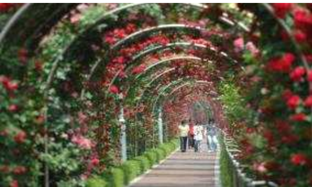
▲ 중랑구 중랑천 장미거리(장미)