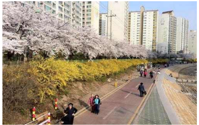
▲ 도봉구 우이천변(벚꽃, 개나리)