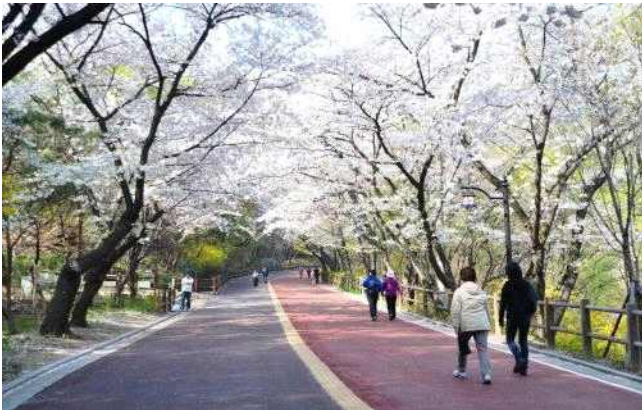
▲ 남산공원 산책로 (벚꽃)