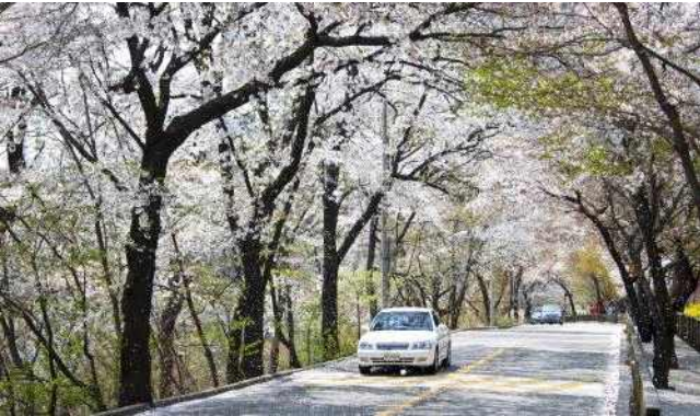
▲ 광진구 워커힐길(벚꽃)