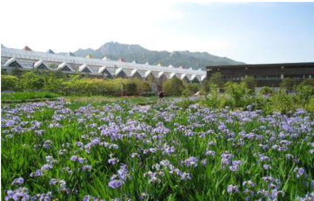
▲ 서울 창포원(붓꽃, 꽃창포 등)