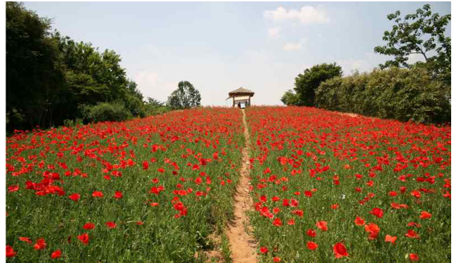
▲ 송파구 올림픽공원(꽃양귀비)