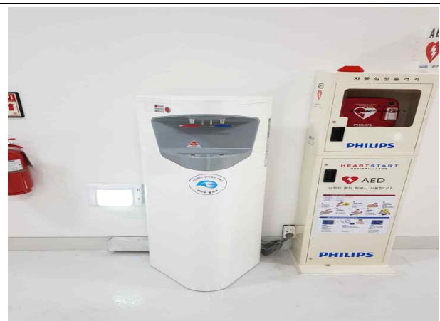
음수대 및 심장제세동기 설치