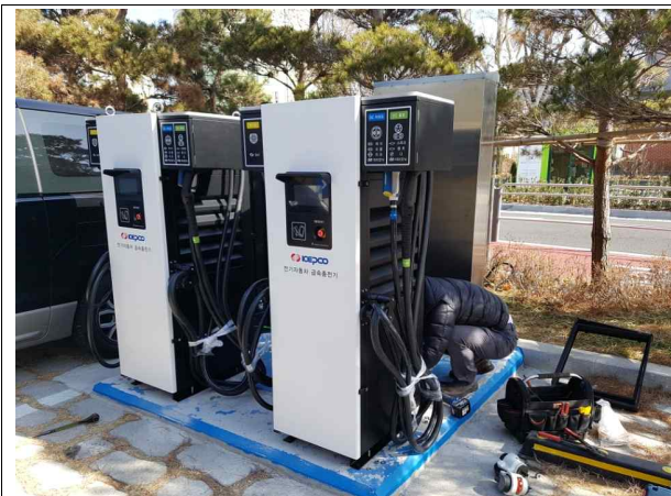
전기차량 충전기 설치