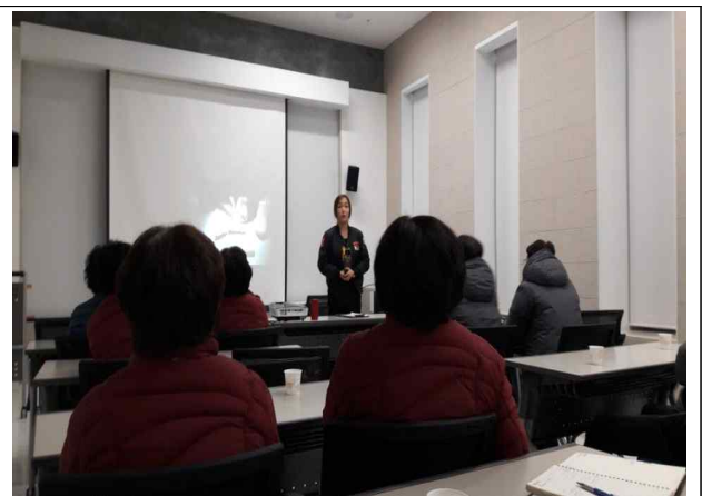
심장제세동기 사용법 교육