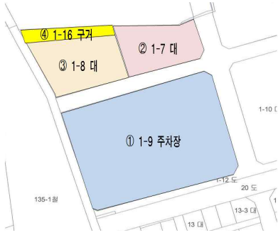
<지 적 도>