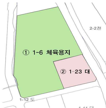
<지 적 도>

○ 문화체육시설 부지 일대 : 도봉구 창동 1-6외 1필지 61,563 m 2