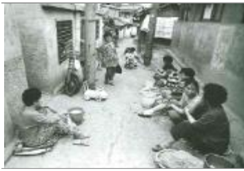
서민들의 소통 공간