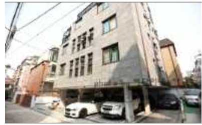
1층이 주차장인 필로티 건물