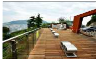
〈부산시 아미동 골목 전망대〉