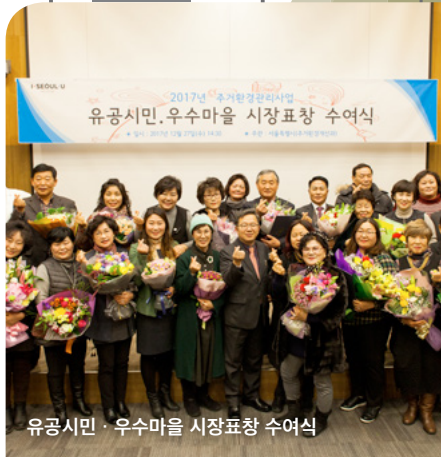
유공시민 · 우수마을 시장표창 수여식