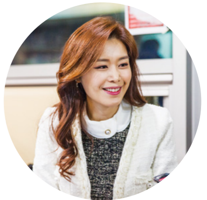
이 호 진 마을 강사 양성과정' 강사 MBC아카데미 아나운서스쿨 주임교수 원광디지털대학교 경찰학과 겸임교수 전 청주MBC 아나운서 전 UBC 아나운서

우리가 항상 누리고 살아가는 마을, 이 마을이 마을다워지고 사람 향기 나도록 수고하고 애쓰시는 분들이 있습니다. 누가 알아주지 않아도 함께 사는 마을을 위해 애쓰신 분들의 수고로 우리 마을이 더 살맛 나게 됩니다. '마을 강사 양성과정'은 이렇게 마을을 섬겨온 분들의 이야기를 보다 더 많은 마을에 알려, 많은 마을이 잃었던 이웃의 정을 보다 더 회복하는 과정입니다. 그래서 과정의 제목을 '설득력 있는 발표 스킬'로 잡았습니다. 함께 사는 마을을 만들자고 한 명이라도 더 설득해야 하기 때문입니다. 처음 강의를 시작하던 날은 대부분의 마을 강사님들이 호흡이 짧고 부정확한 발음, 굳은 표정 등 아쉬운 부분이 있었습니다. 8주가 지난 지금은 발표 스킬도 좋아지고 무엇보다 발표하는 것을 즐기는 분들도 생겼습니다. 정말 눈에 띄는 변화에 저도 보람이 큼니다. 특히 이 수업에 참여하는 분들은 뚜렷한 목표가 있습니다. 내가 속한 공동체, 마을을 사랑하고 더 잘 알고자 하는 것. 그런 마음과 짐은 강의를 하는 저에게도 고스란히 전달되어 가슴 뛰게 합니다. 마을을 위해 애쓰시는 귀한 분들의 이야기가 멀리멀리 알려졌으면 좋겠습니다. 멋진 마을 강사님들의 활동을 기대합니다.