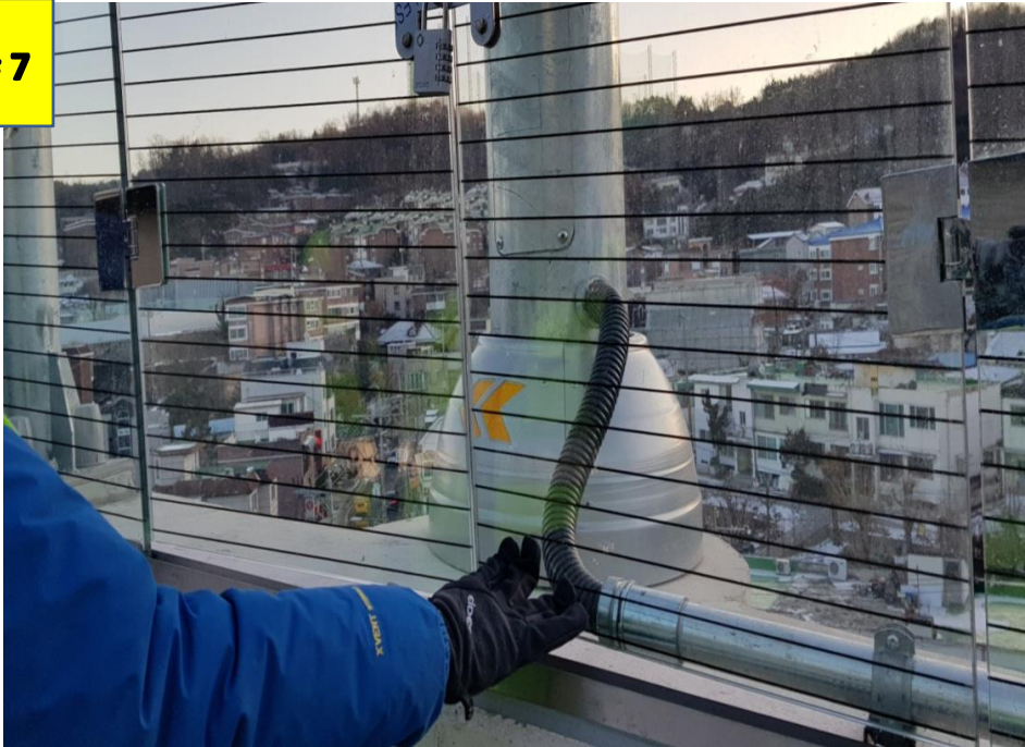
사진 # 7