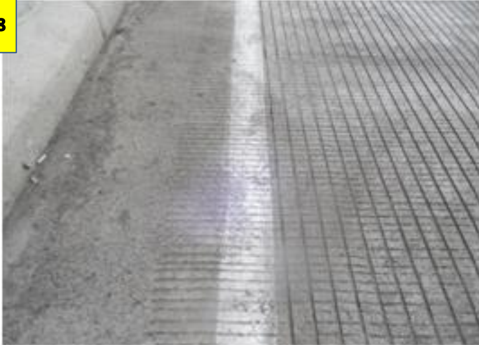
사진 # 8