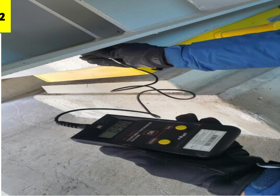
사진 # 2