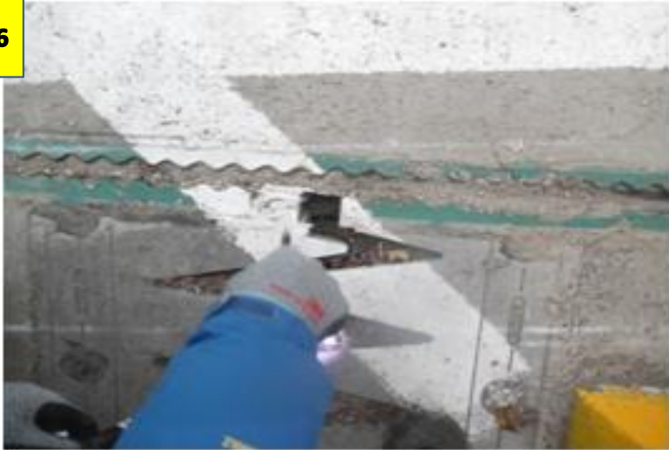
사진 # 6