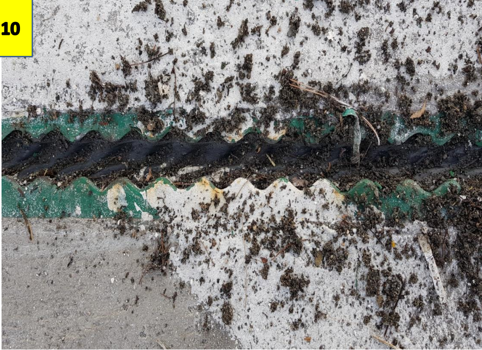
사진 # 10