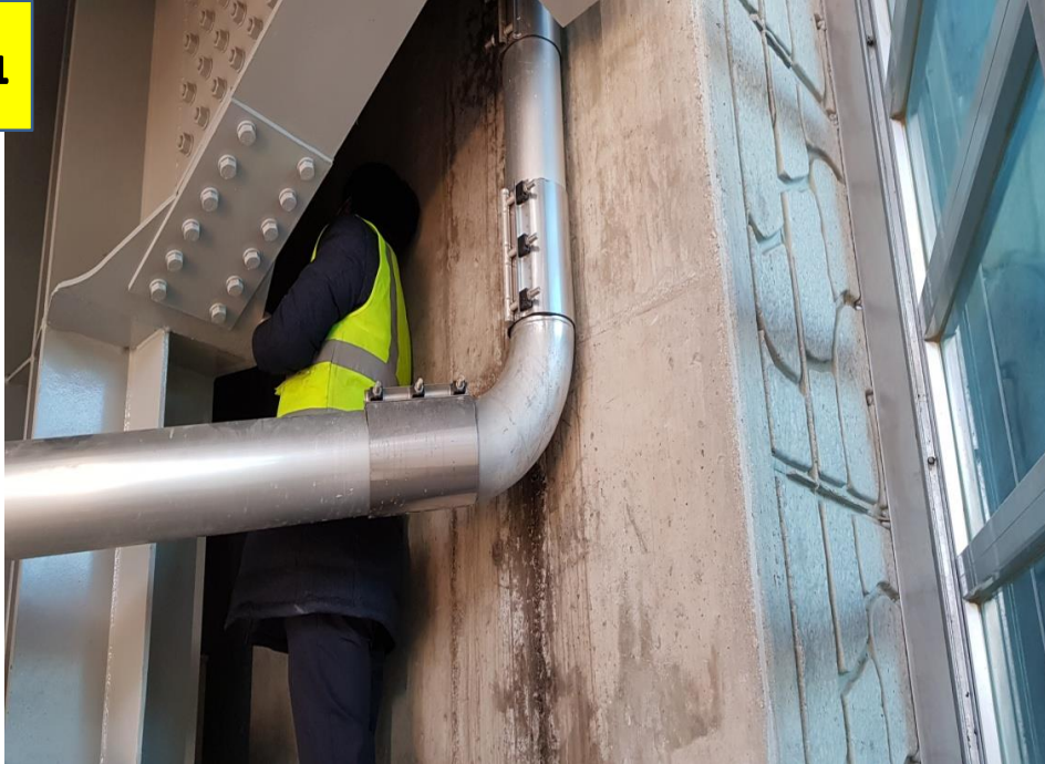
사진 # 1