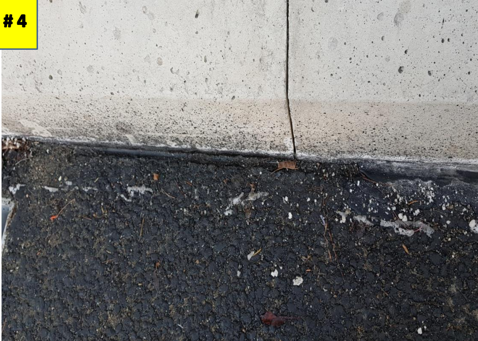
사진 # 4