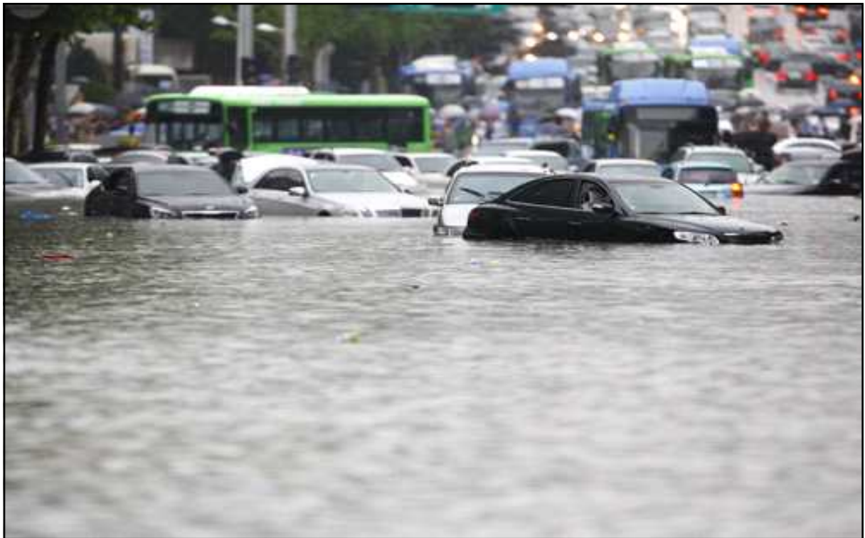
2011.7.27.~28 강우시 침수피해 현황