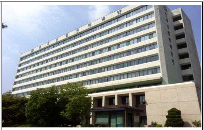
서울시 창업허브센터(마포구 백범로 31길)