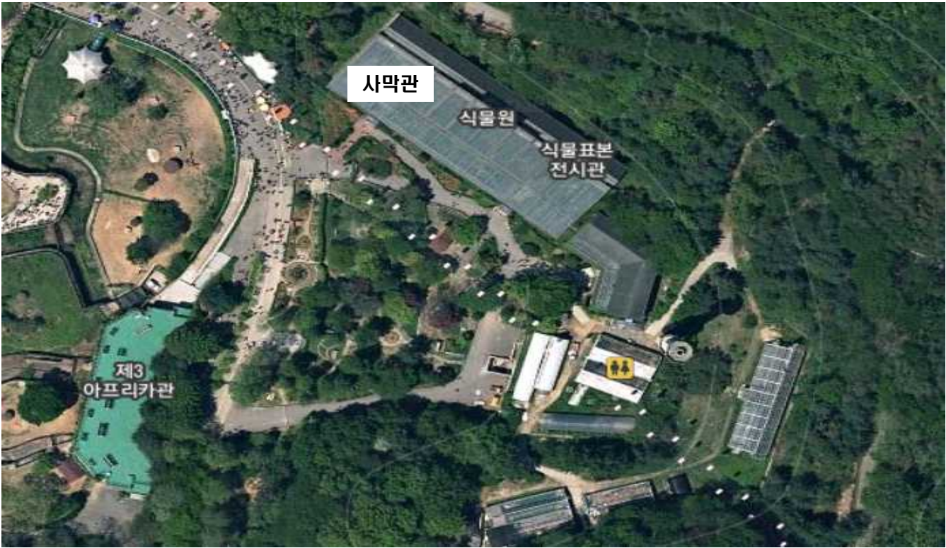
서울대공원식물원 전시온실 사막관