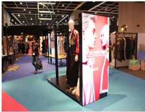
<중앙통로 브랜드 '봄' 의상 전시>