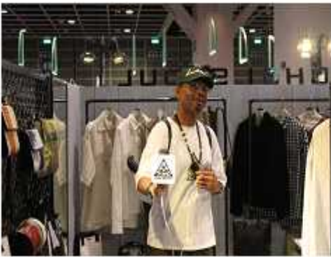
<DDM스퀘어 브랜드 취재>