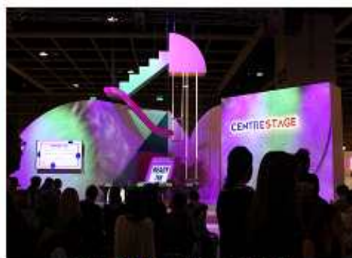
<전시장 내부 중앙 스테이지>