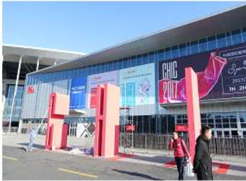
<CHIC 전시장 2Hall 전경>