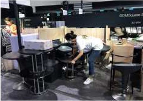
<집기 수령 및 배포>