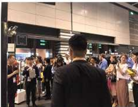
<프레스 대상 프레젠테이션 진행>