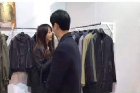
<왕홍 '에노에이치' 부스 취재>