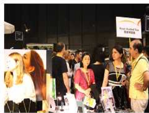
<VIP 바이어 투어>