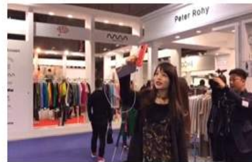
<왕홍 'DDM스퀘어' 부스 취재>