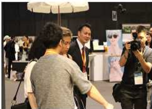
<프레젠테이션 종료 후 개별취재>