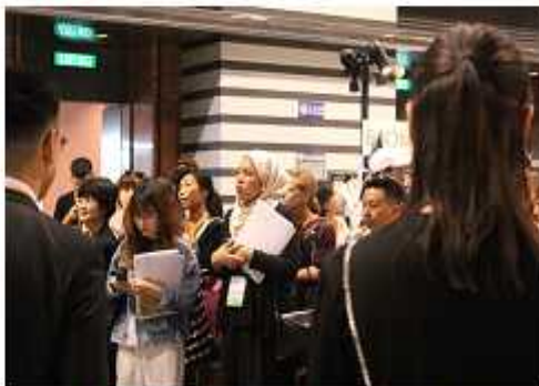
<초청 프레스단 프레젠테이션 경청>