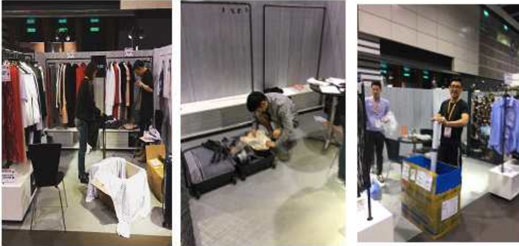
<부스철수 및 집기반납>