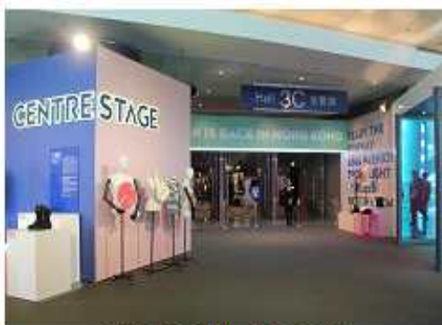
<전시장 3Hall 입구 전경>