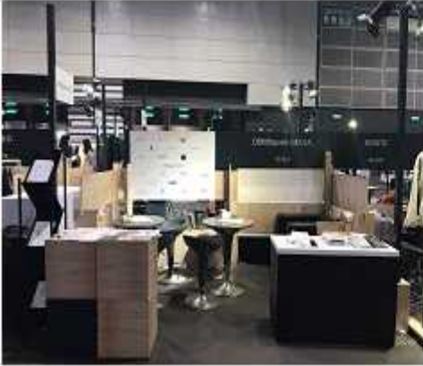
<DDM스퀘어 바이어라운지 및 공동북북 배포>