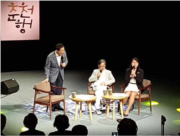
[박원순 시장님과 명사패널이 함께 하는 50+이야기]