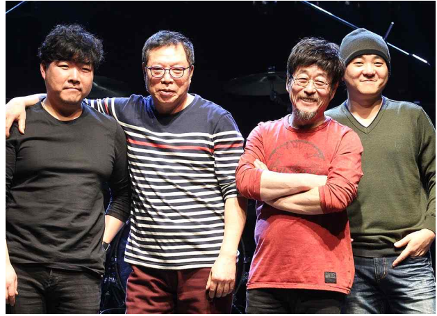
[김창완밴드와 청년밴드의 콜라보무대]