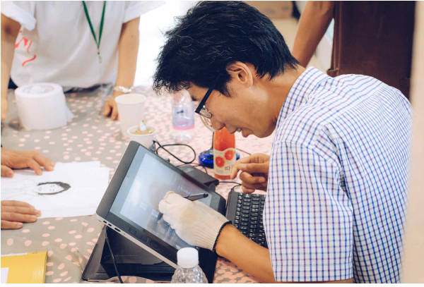
[캐리커처 - 사회공헌]