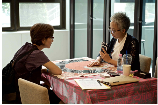
[타로마스터 - 사회공헌]