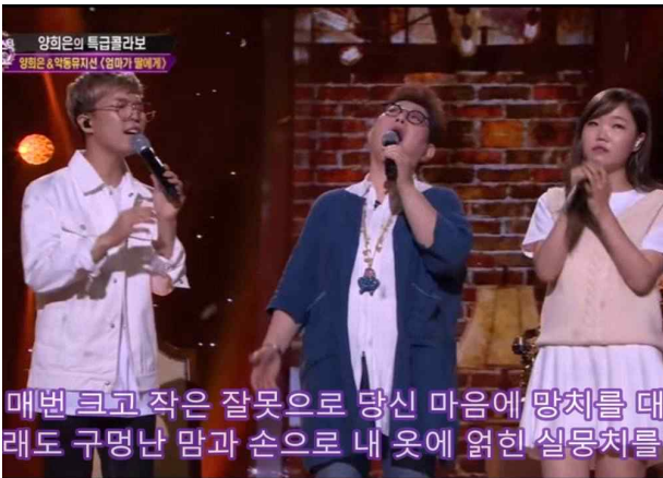
[엄마가 딸에게 - 세대공감 콜라보]