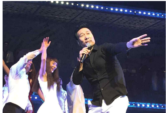
[50+가 좋아하는 대표뮤지션 축하공연]