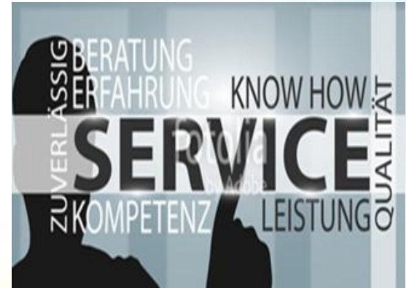
아웃소싱 Know-how 보유

자체 전산프로그램 개발 및 서비스 운영을 위하여 K(Knowledge), S(Skill), A(Ability) 를 갖추고