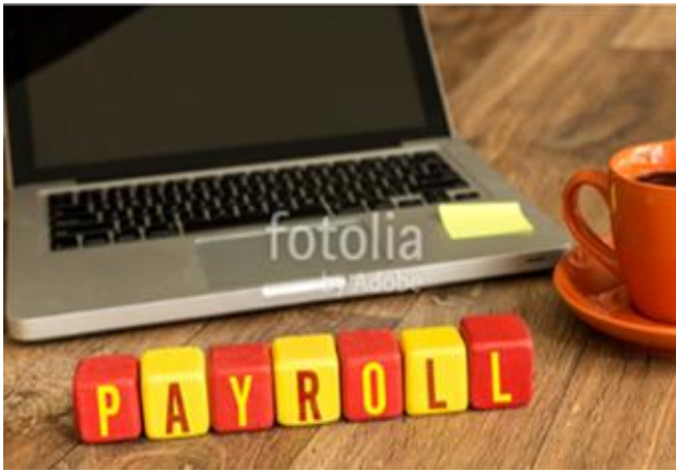
자체 전산프로그램 개발능력