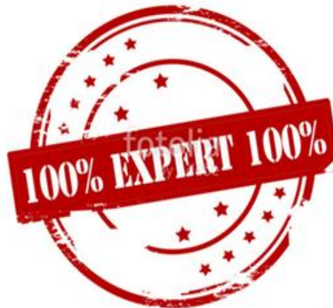
실무 전문가 확보