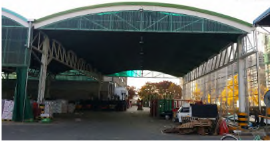
(신축 비가림시설 정면)