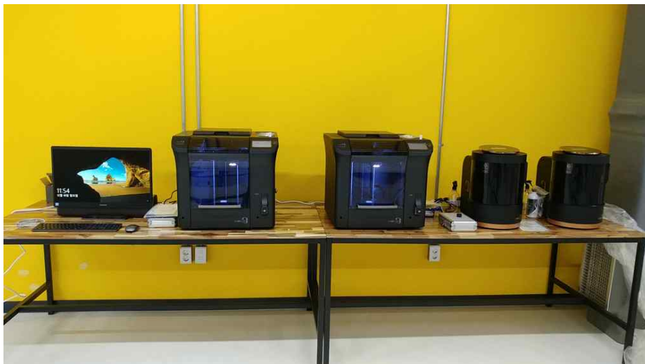
큐비콘싱글 플러스 2대, 큐비콘 럭스 2대