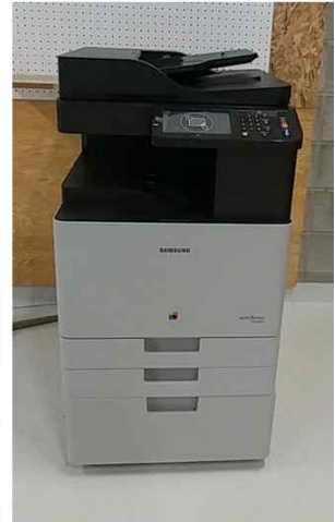
PC 3대 , APEX G 포스기, 복합기