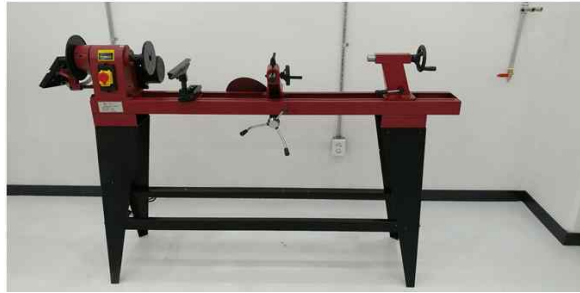
디스크샌더, 드럼샌더, 테이블쏘, 목공용선반