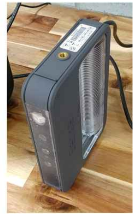
PC 2대, 3D 스캐너