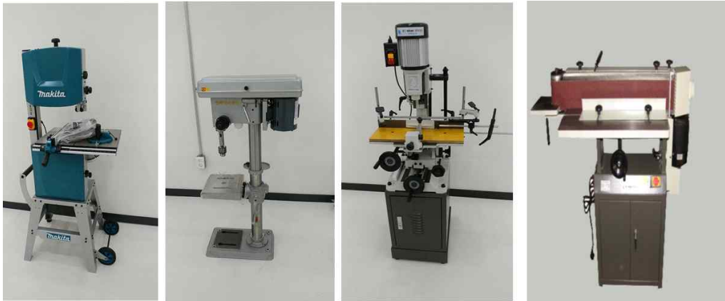
밴드쏘, 드릴프레스, 각끌기, 자동수압대패기