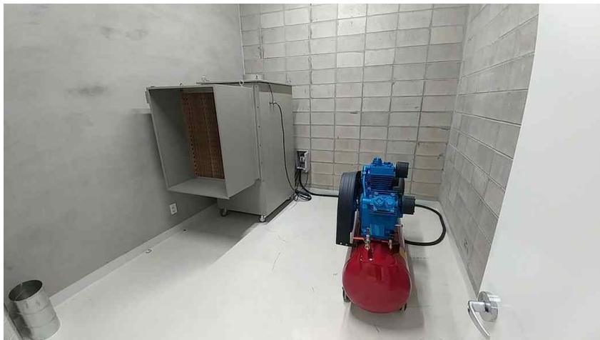
도색용 집진기, 10마력 에어프레셔