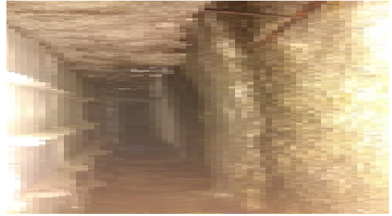
벽체 내부 누수 사진