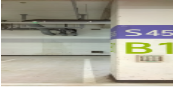
벽체 외부 누수 사진