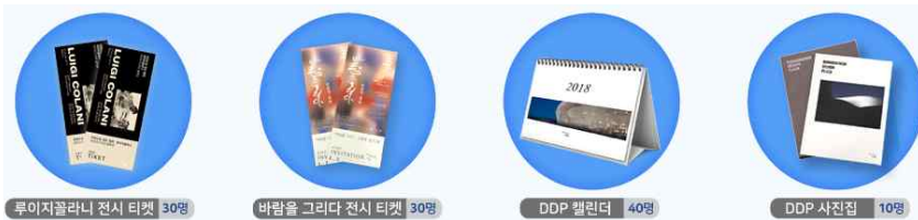
경품 사진 자료

※ 성실히 응답해 주신 10분께 추첨을 통해 「2018 DDP 캘린더, DDP 사진집, 루이지 폴라니 전시 티켓, 바람을 그리다 : 신윤복·정선 전시 티켓」을 드립니다. (설문 마지막 질문에 연락처를 꼭 남겨주세요. 경품 당첨 시 남겨주신 연락처로 본인 확인 후 경품을 보내드립니다.)