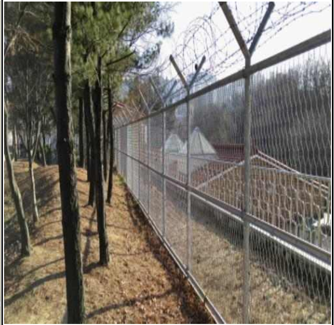
신림6 배수지 관리상태 점검