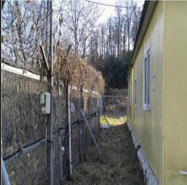
신림9 배수지 관리상태 점검