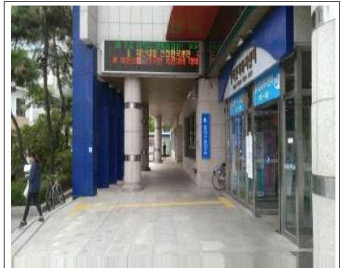
전광판 (문화복지센터 외 15개소)