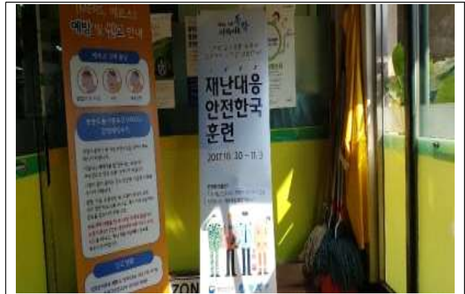
구청 별관 정문