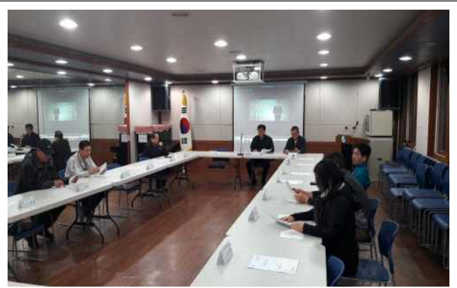
동 주민센터 체육행사