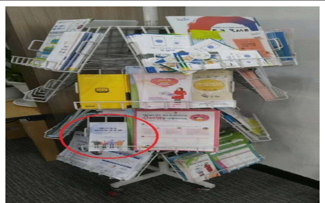
동 주민센터(상도2동 외 14개소)