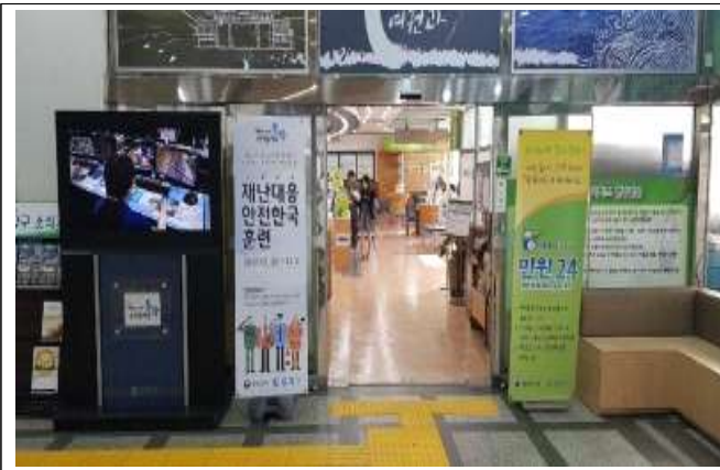
구청1층 민원실 앞