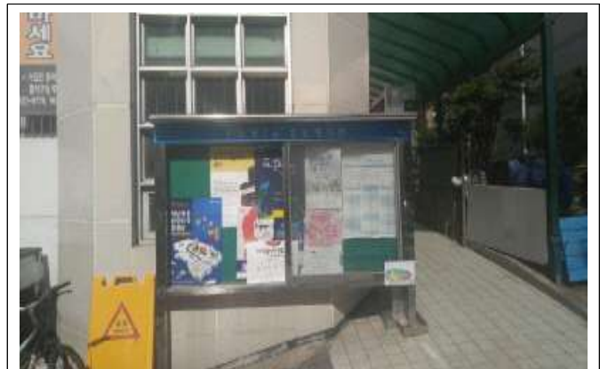
동 주민센터(상도2동 외 14개소)