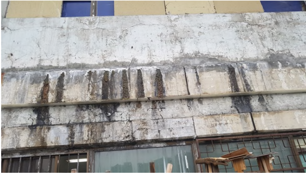
사 진 11 시설명 진양상가 3층 내 용 외부 누수균열 및 철근부식