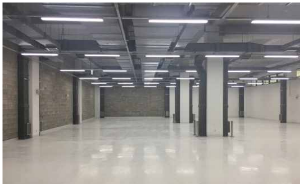
'꿈꾸는 공장' 내부 사진