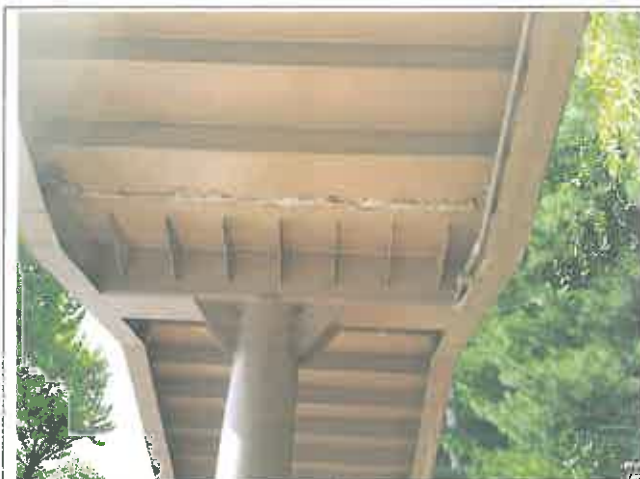
계단부 누수 및 부식