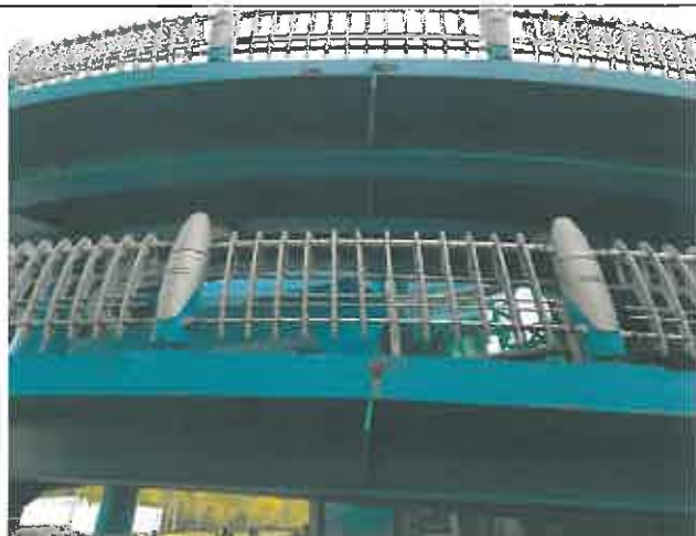
주형/계단하부 및 난간기초 강재 일부분 부식 발생