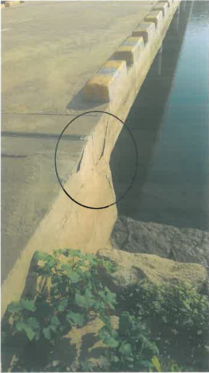
사진 <#세월 1-a>