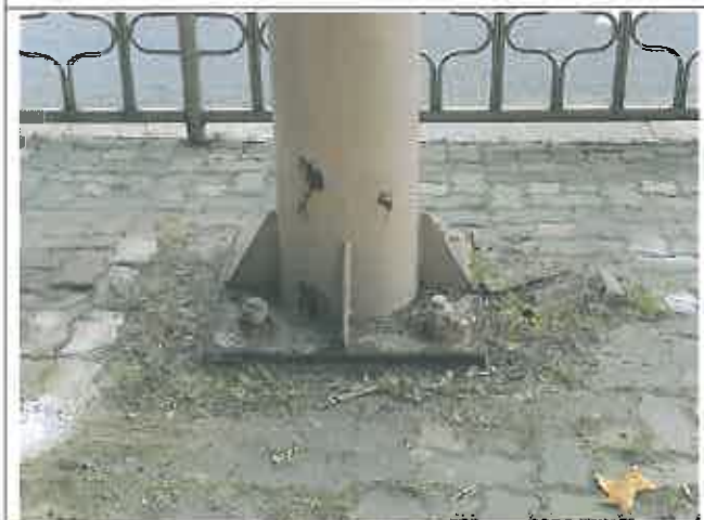
기둥부식 및 기초콘크리트 파손