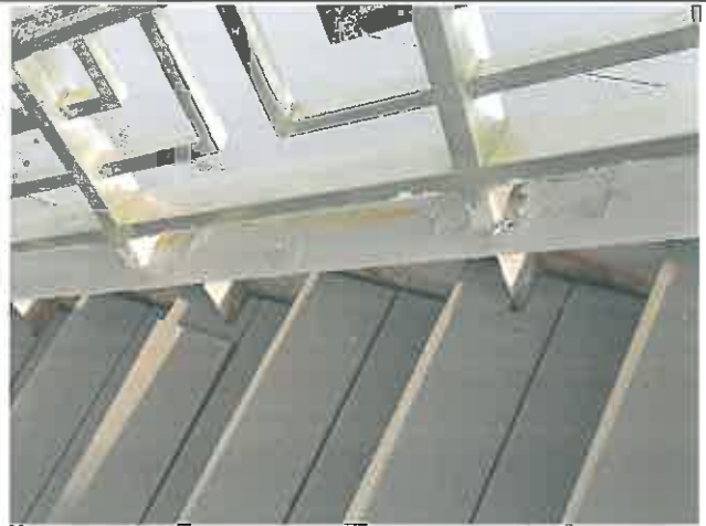
계단부 목재데크 흔들림