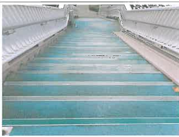
계단부 논슬립 파손