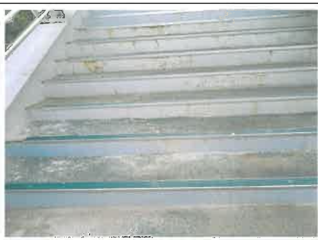
계단부 포장상태 불량 및 부식