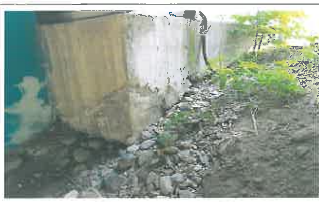
EV실 기초부 일부 세굴