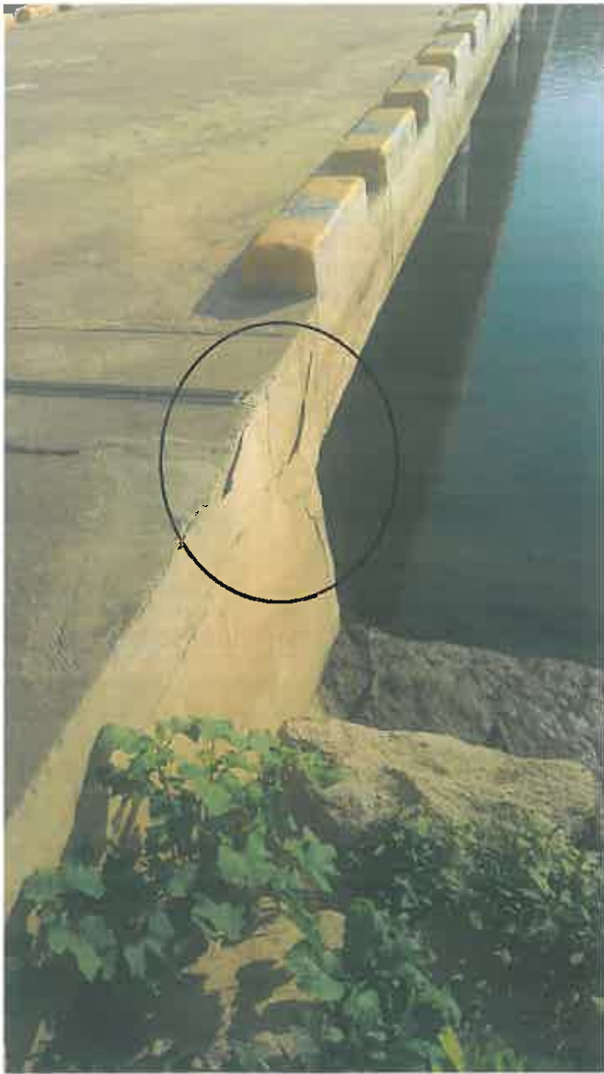
사진 <#세월 1-a>