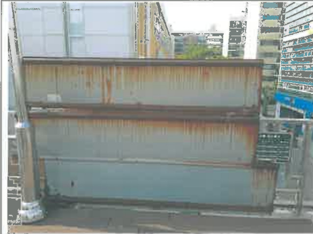
학교측 계단폐쇄 강재부식