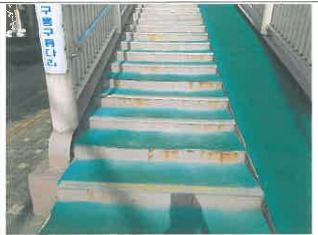
계단부 포장상태 불량 및 부식