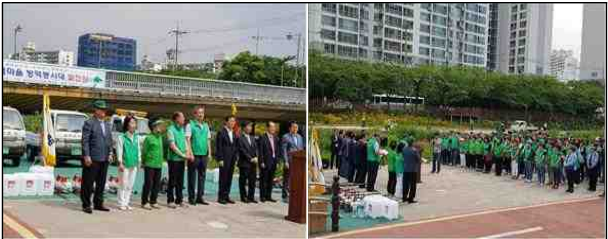
새마을 발진식 행사