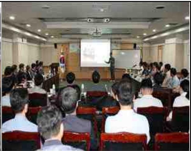
교육 (재난현장 수습 역량강화)