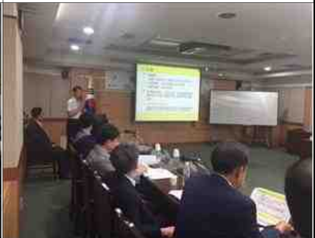
재난발생 유형에 따른 수습 및 개선사항 발표