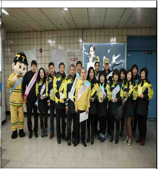
부구청장 및 의용소방대