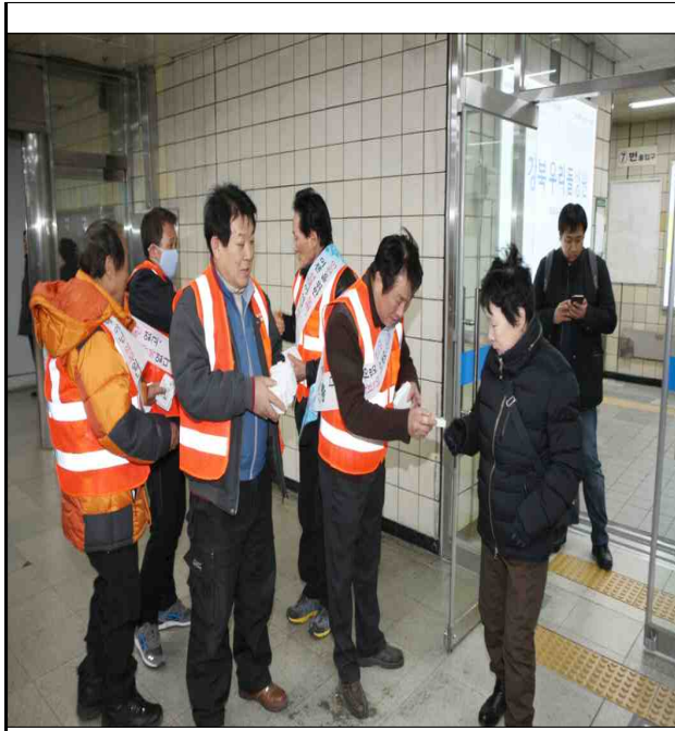
자율방재단 홍보물품 배포