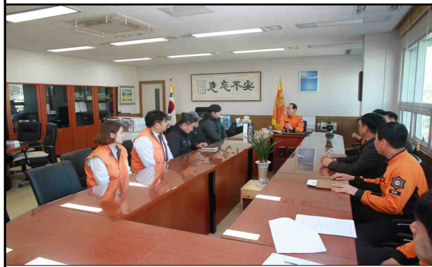
점검활동 및 회의