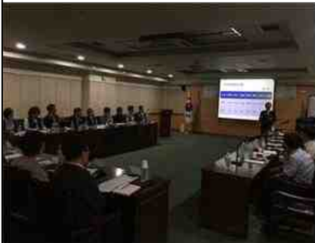
교육 (붕괴 사고에 대한 수습 및 대처방안)