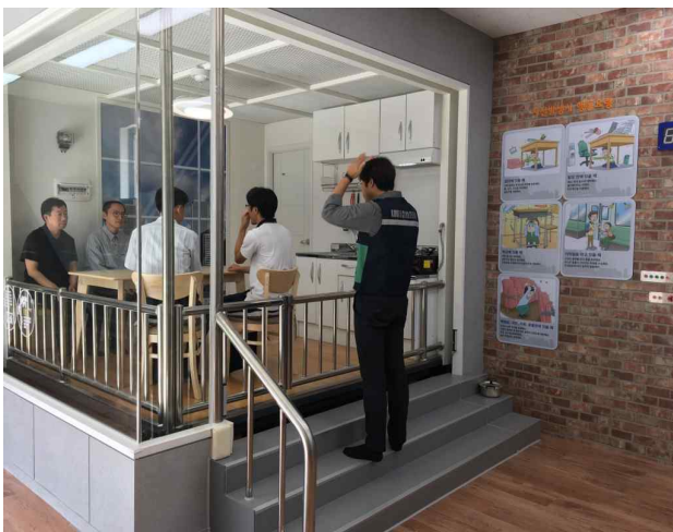
▶ 내용: 지진, 선박탈출, 소화기, 완강기 안전