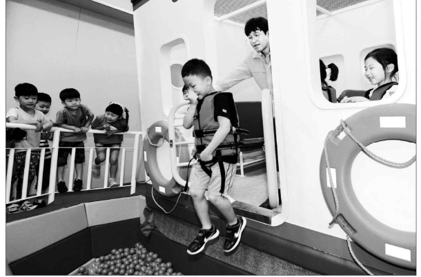
위기 탈출법, 직접 체험해요 18일 서울 성동생명안전체험관의 지진·해양선박탈출 체험장에서 관내 유치원생들이 해양선박 탈출 체험을 하고 있다. 체험장에는 선박의 실제 침몰 상황을 가정한 흔들리고 기울어진 상황을 재현한 모형 선박을 설치해 운영한다.