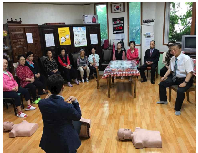
▶ 내용: 심폐소생술, 자동심장충격기 사용법