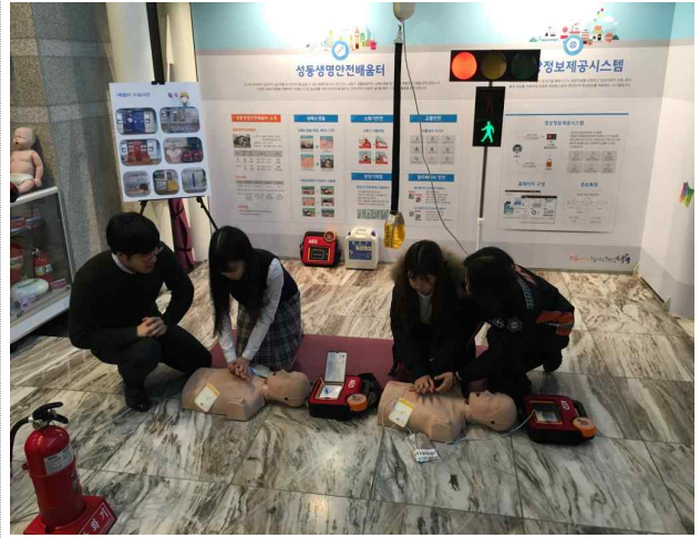
성동, 더(The) 안전혁신 선포식

▶ 내용: 안전도시 조성을 위한 정책방향 의지를 다짐하는 행사(2017. 01. 19)