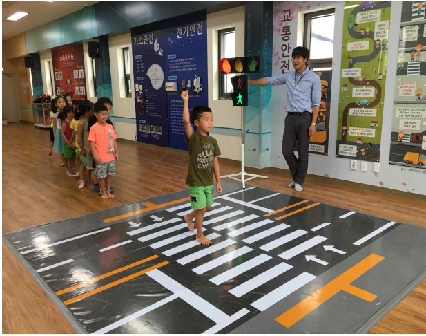
▶ 내용: 교통안전 교육 진행