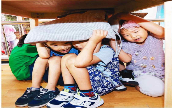
“지진 나면 책상 밑으로” 재난 체험하는 어린이들 “지진이 나면 책상 밑으로 들어가 방석으로 머리를 가리세요.” 18일 서울 성동구 성동생명안전체험관에서 유치원생들이 지진이 났을 때 대처하는 체험을 하고 있다. 실제로 지진이 난 양 표정이 진지하다. 성동생명안전체험관에서는 지진을 비롯해 선박 탈출 대처법 등을 배울 수 있는 체험 프로그램을 운영한다.