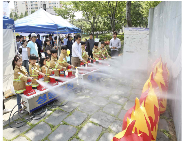
성동 온마을대축제 와글와글

▶ 내용: 어린이날을 기념해 아이부터 어른까지 온 가족이 함께 즐길 수 있는 축제 장을 마련 (2017. 05. 05)