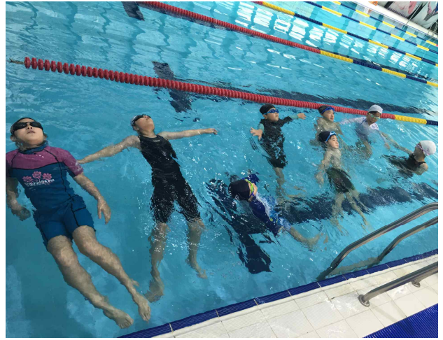
▶ 내용: 수상안전교육 및 전기, 엘리베이터 안전