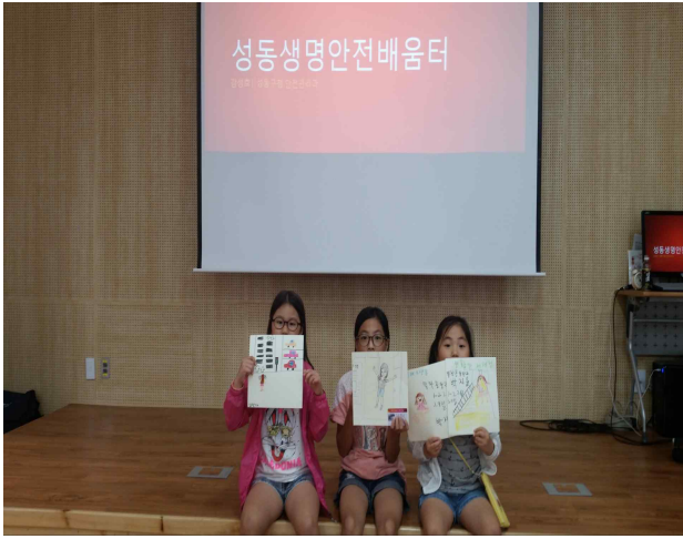
생명안전체험 및 안전그림그리기

▶ 내용: 가족과 함께하는 안전체험을 진행하고 그 의미를 그림으로 표현(2015. 07. 11)