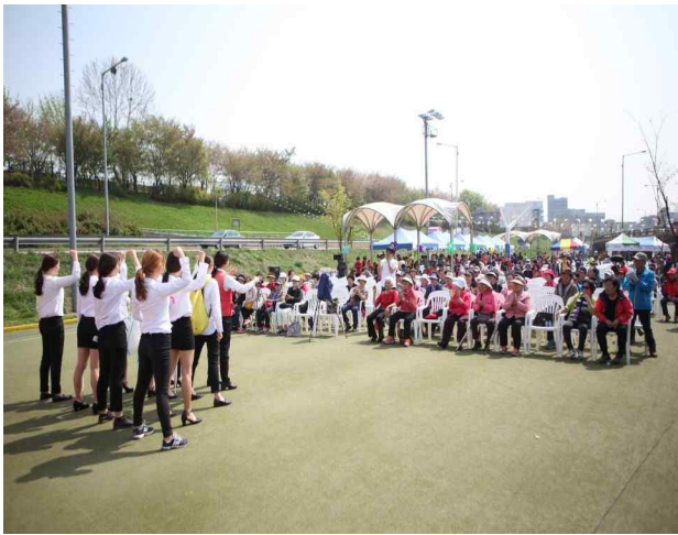
성동구 송정동 벚꽃 축제

▶ 내용: 성동구 송정마을의 전통있는 행사로 다채로운 행사와 더불어 안전체험 부스를 만들어 운영(2017. 04. 07)