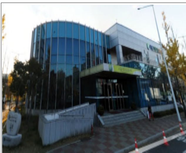
친환경 유통센터(1센터) 건물전경