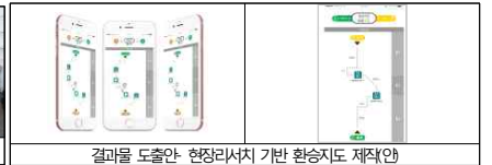
결과물 도출한 현장리서치 기반 환승지도 제작안