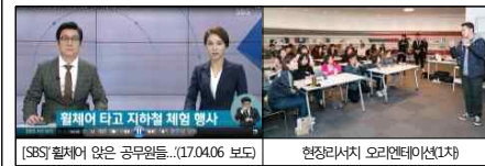
[SBS] 휠체어 없는 공무원들..(17.04.06 보도) 현장리서치 오리엔테이션(1차)