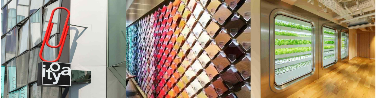
긴자식스 입구 사인