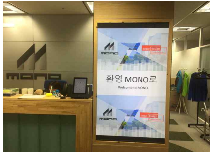
서울디자인재단 환영 안내