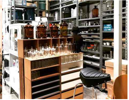
가구 및 주방 소품 판매