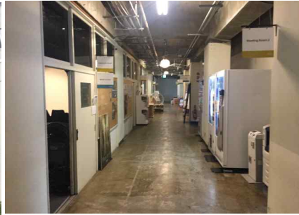
학교 복도공간의 100% 활용