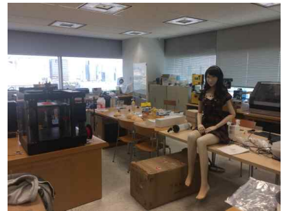
3D 프린팅 및 공동작업공간