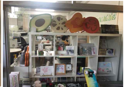
입주공방 (전면유리를 이용한 상품전시)