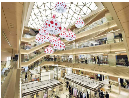
긴자식스 중앙 중정