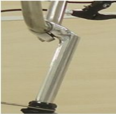
9. 핸들 스템