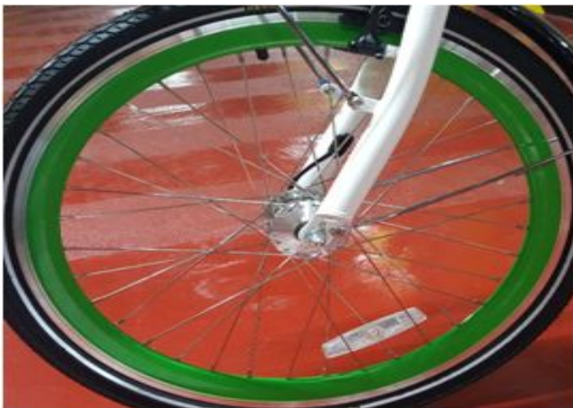
3. 전륜 휠 SET(고정 볼트 포함)