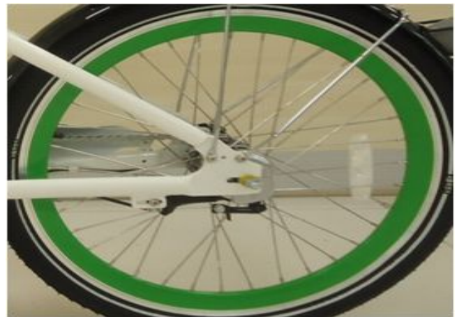
4. 후륜 휠 SET