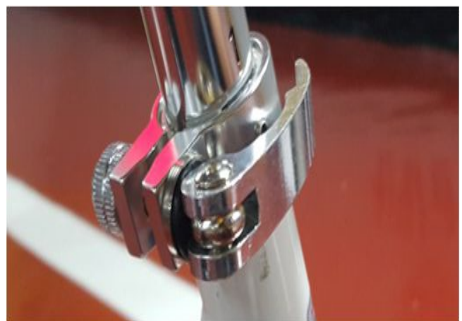
6. 시트 클램프 + 시트핀