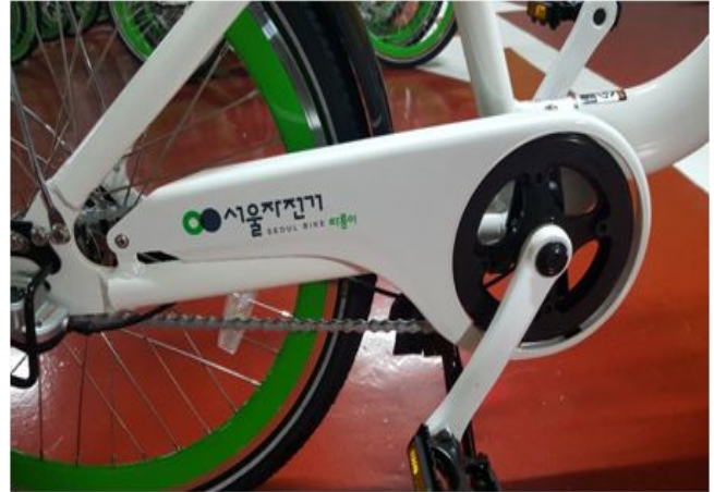
2. 체인케이스(볼트 포함)