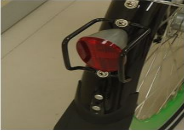
19. 리플렉터(흙반이 전용)