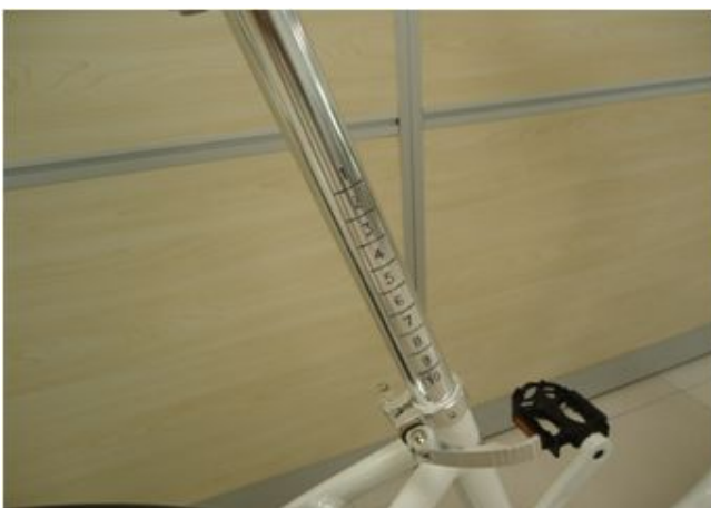
5. 시트 포스트