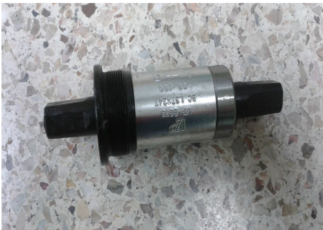
11. B.B SET