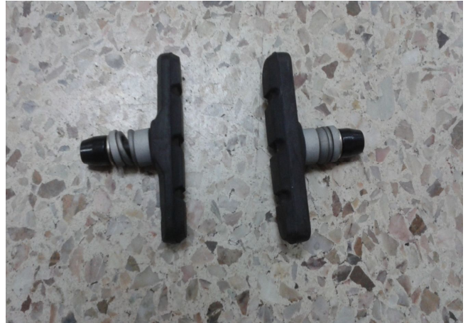
10. 앞 브레이크패드