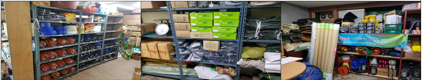
동 풍수해 대비 자재창고(번1동, 수유1동, 인수동)