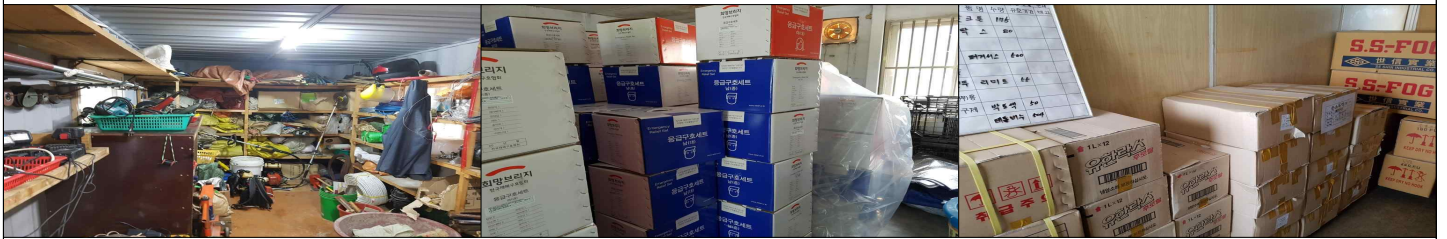
산사태 대비 자재창고와 재해구호물품, 방역창고