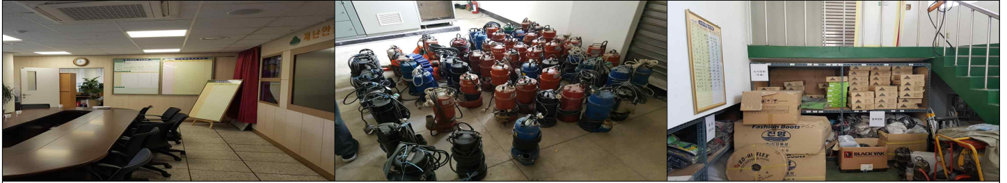
안전치수와 재난안전대책 상황실과 자재창고