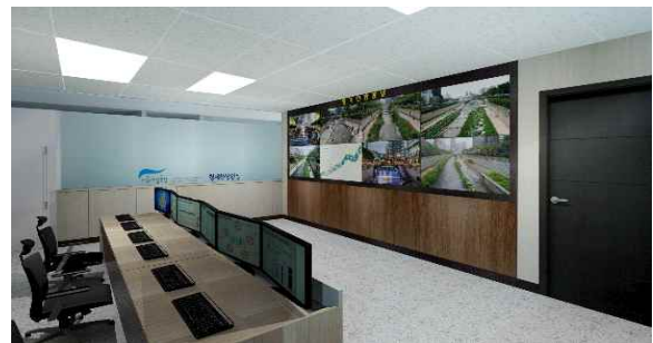
상황센터 3D 조감도