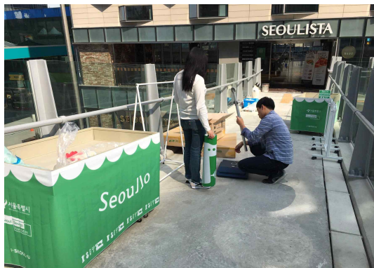
매대 외부 현수막(1200x750)