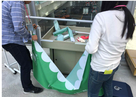
매대 외부 현수막(1200x750)