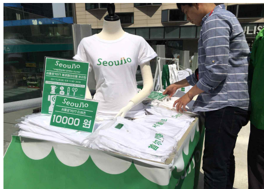
상품 디스플레이(마네킨, 가격표 등)