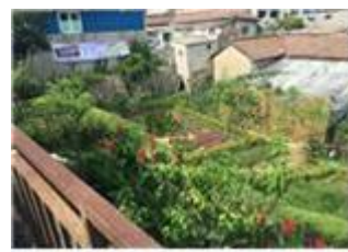
노원구, 수암사랑이 꽃밭(나비정원) 조성