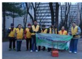
동작구 장애인쉼터 봉사단체