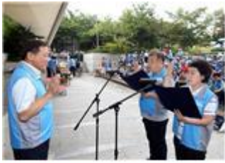
금천구, 골목길 자율 청소책임제 발대식