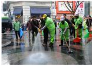
설날 명동거리 대청소