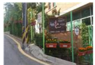
도봉구, 행복마을 추진단 정의여고 통학로 화분 설치