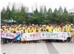
구로구, 외국인 밀집 거주지역 환경캠페인