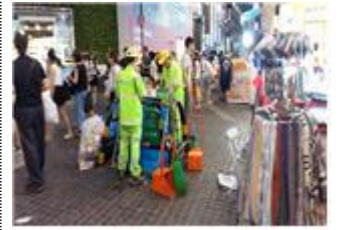
명동관광특구 청결기동대 활동