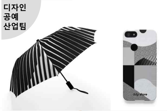
디자인 공예 산업팀