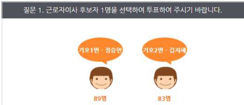
[결과 증빙 이미지_그룹웨어 설문조사 게시판]