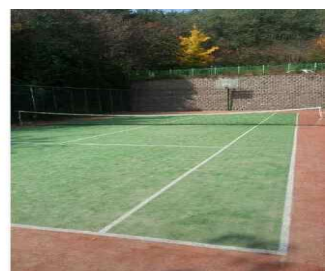
서울시 속초 공무원수련원