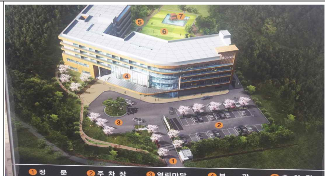
서울시 보증보험 수련원(강당)