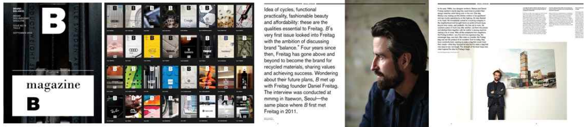
<한 가지 주제를 심층적으로 다룬 매거진B>