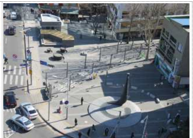
북인사마당 조형물 및 물동이 분수대