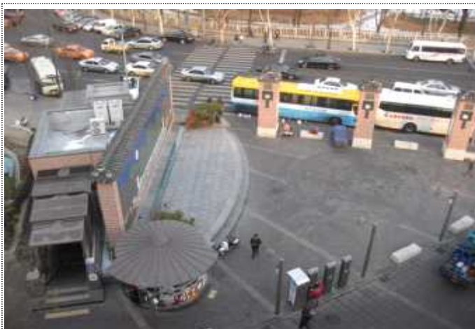
남인사마당 야외 무대 (지하 화장실)