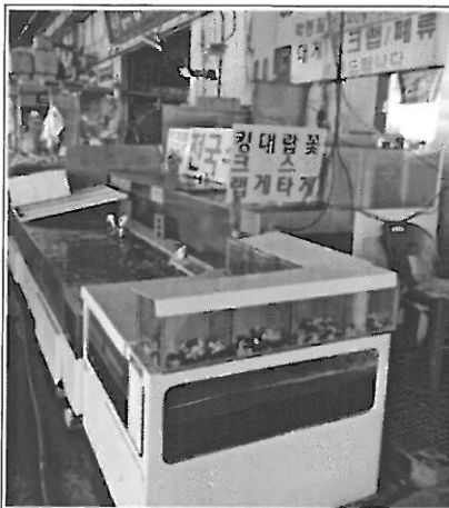
기존 시설물(배송복동 남측)