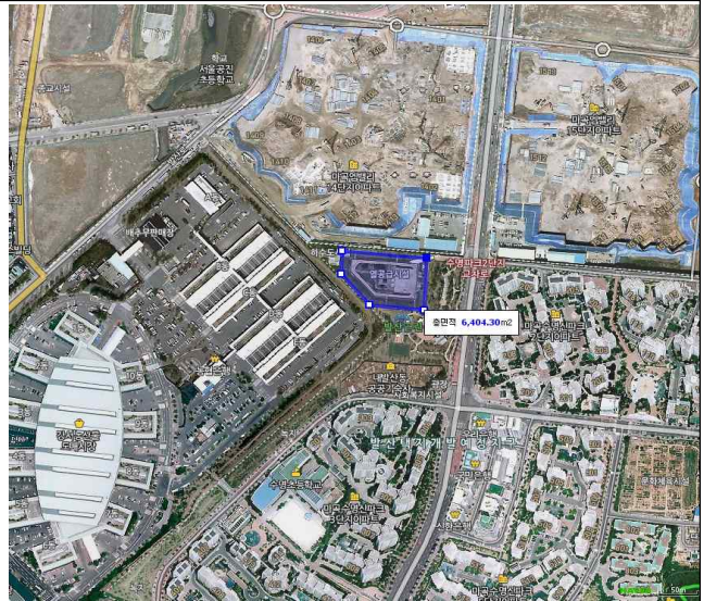
서울특별시 강서구 수명로 95