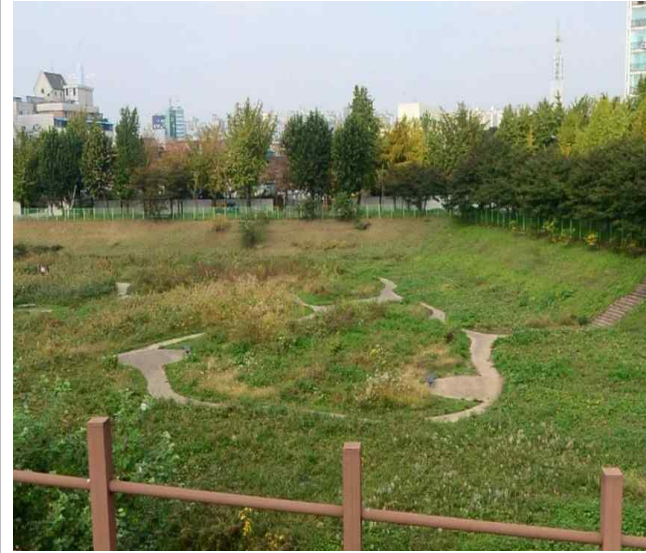
서울특별시 송파구 잠실동 306