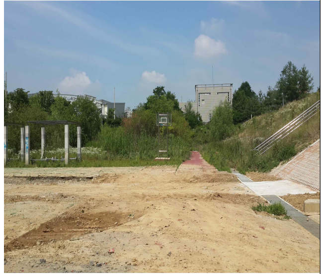
서울특별시 강서구 수명로 95