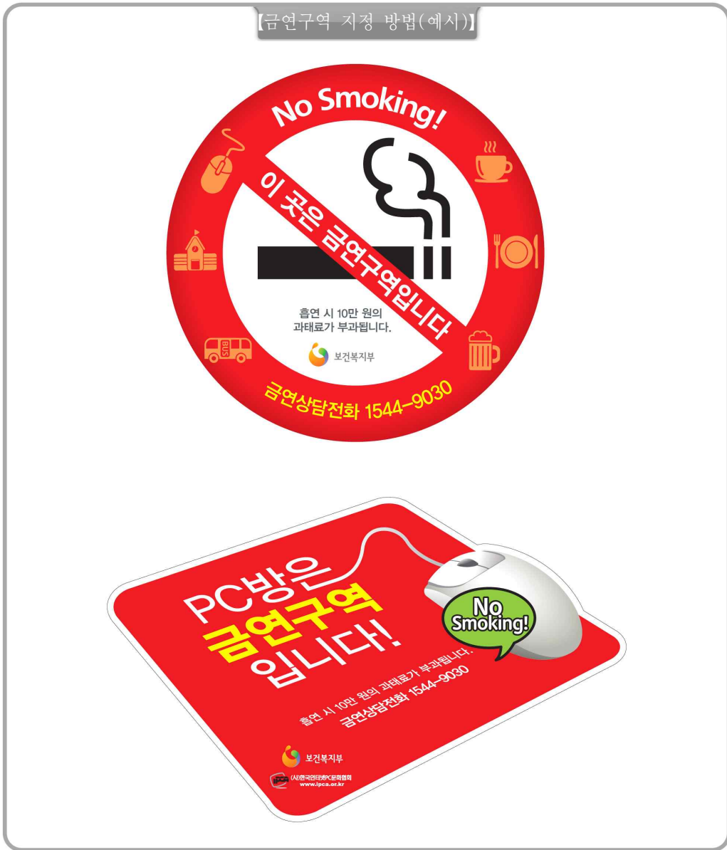
【금연구역 지정 방법(예시)】