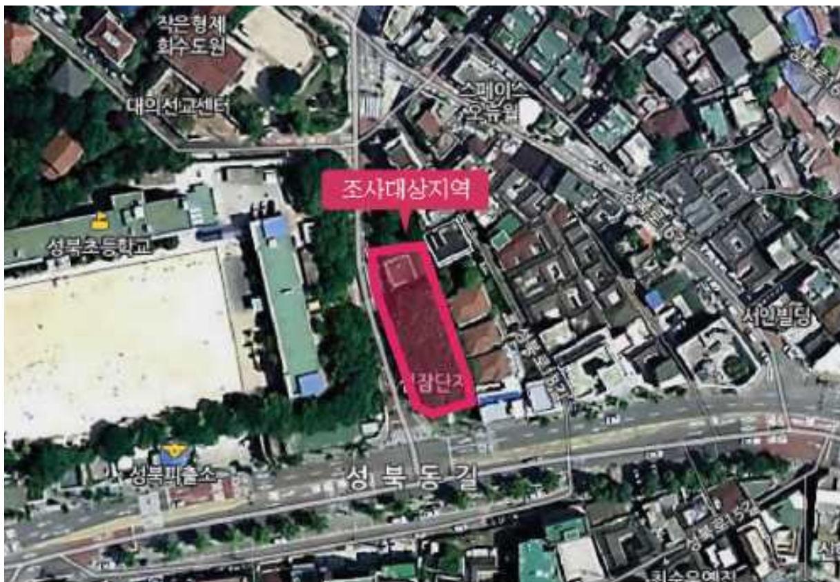
【사진 1】 조사대상지 위성사진(국토지리정보원)