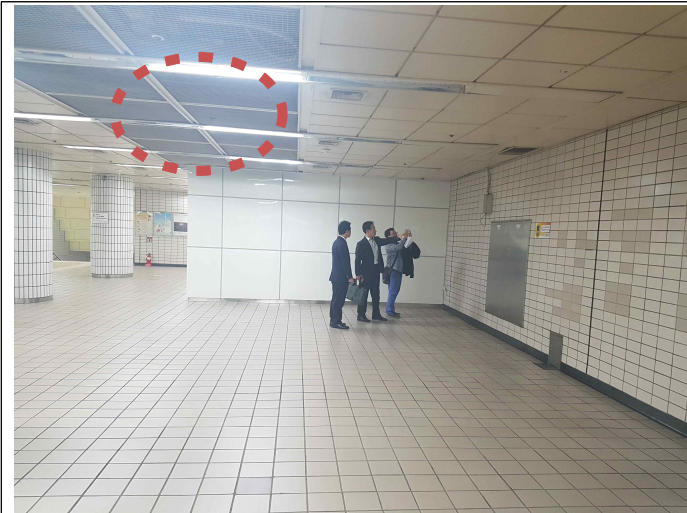
경량철골 천장틀(용접철망) 위치: 대합실 천정