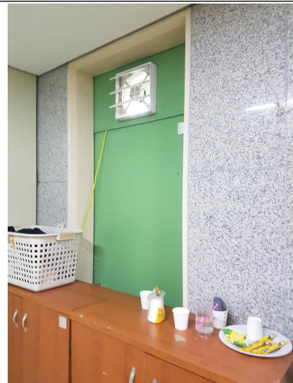
철제 출입문 위치: 기능실 출입문(기능 상실로 철거)