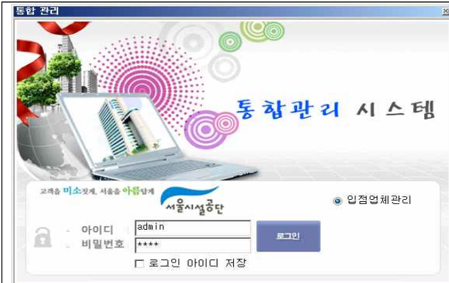
최초 로그인 화면