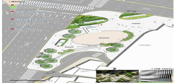
조감도(동대문 DDP 인근 녹지)