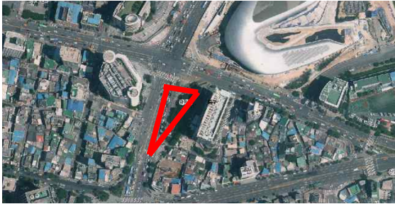
동대문 DDP 인근 녹지