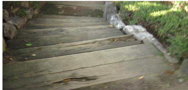
노후된 시설물(목재 계단 파손 전경)