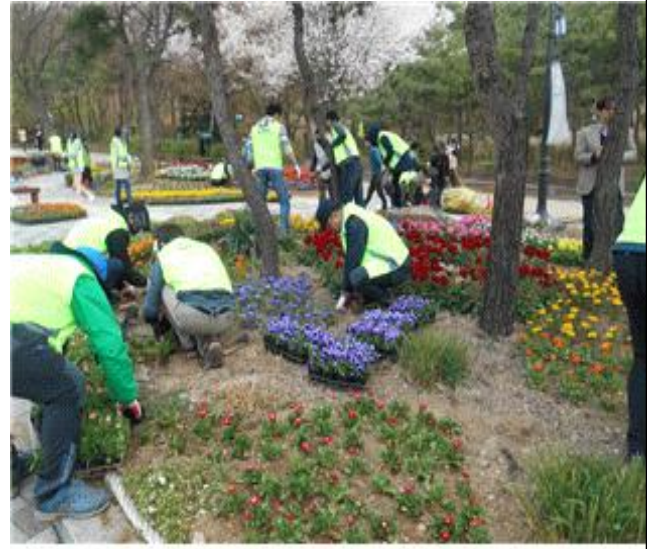
직접 참여하는 녹지대 관리 등 자원봉사 확대