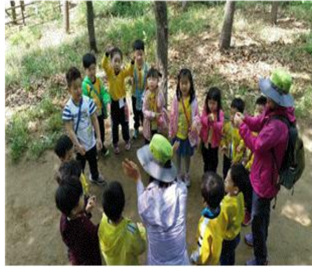
남산공원 유아숲체험장 이용현황