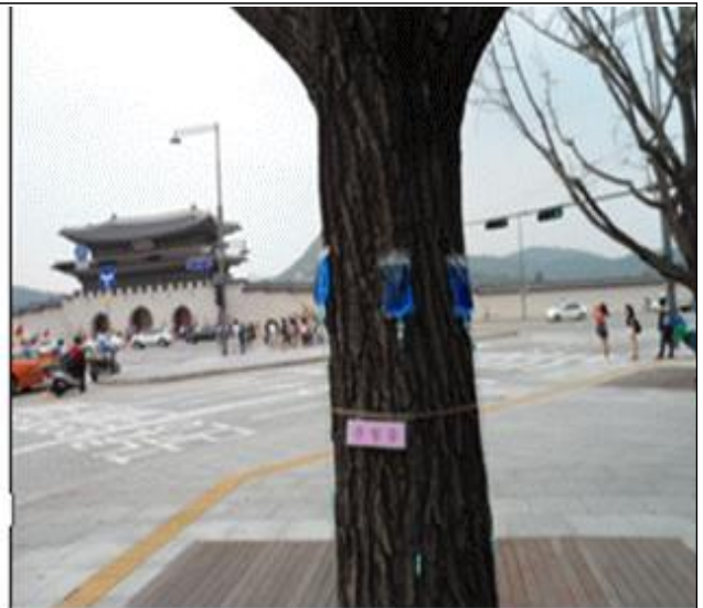
세종로 가로수 유지관리(수간주사)