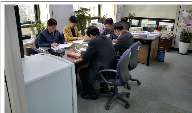
추진단 구성 및 운영방안 관련 논의