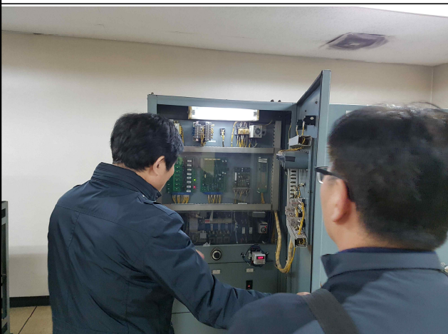
<신호기계실 UPS 점검>