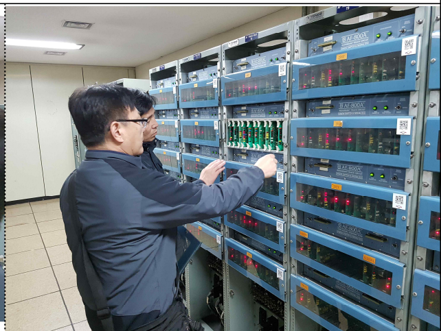
<신호기계실 궤도회로 점검 >