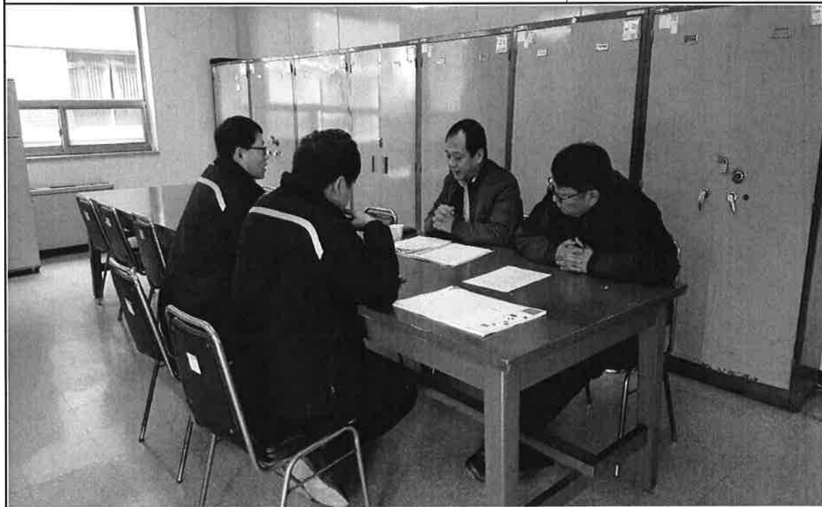
사 진 설 명 촬 영 일 시 부조리 근절 대책 설명 2016. 11.