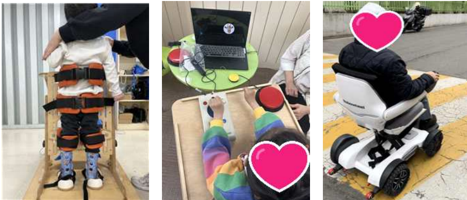
〈보조기기 현장적용 사진〉